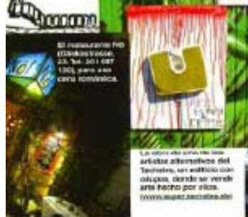
El restaurante Pro (Eckbühlstraße 23, Tel. 030 687 130), para una cena romántica.