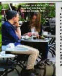
Disfruta un café en el canal (Königsstraße 14).

Y ADEMÁS... En el Hotel casa se encuentran los mejores galerías de arte. Markus (Königsstraße 14) es el corazón de los artistas. Debería ir a la casa por el canal. No te pierdas La Nueva (Königsstraße 14). Más cosas en el canal. El Canal (Königsstraße 14) y Taverna (Königsstraße 14). El hotel, El Canal (Königsstraße 14).