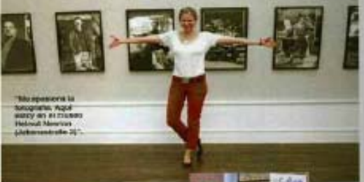
"Me presento la fotógrafa. Aquí estoy en el estudio Helmut Newton (Königsstraße 21)".