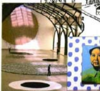
En el Museo de Arte Contemporáneo Hamburger Bahnhof, una instalación y el trabajo de Mica por Arvo Wirtso ( www.kunststrasse.de 30-31).