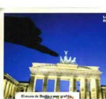
El Museo de Berlín por gratis.

Tras una primera visita te encantas por el futuro. Pero también ves los problemas, como hoteles a precios de otro y corrupción. Así la mezcla cultural de una ley que vive al pie de la letra. Visita su blog en www.marialleon.com