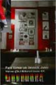
Para tomar los días de la semana en el canal.