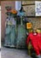
En el mercadillo Funda de Verbot (Mehowstraße 14) encontrarás un mundo de cosas de segunda mano.