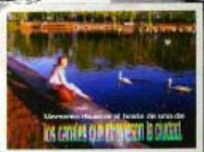
Morosa muestra el lado de otro de las canales de Berlín en el canal.